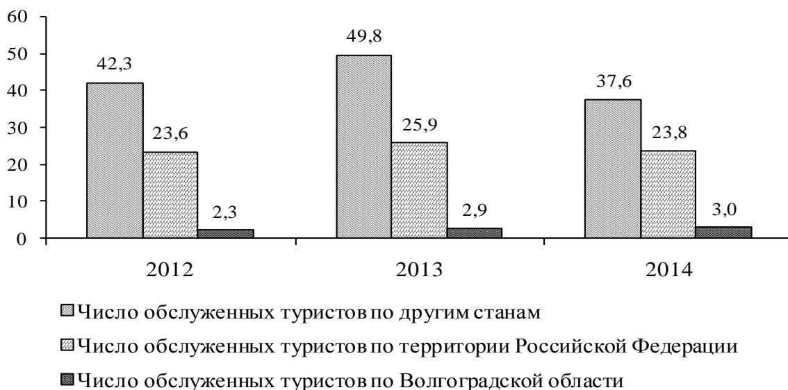
Рисунок 1 - Число обслуженных туристов в распределении по странам, тыс. человек

Средняя стоимость турпакетов по России в 2014 году составила 26,6 тыс. рублей, что на 36,4% больше, чем в 2013 году, по другим странам - 56,7 тыс. рублей, что на 16,9% больше по сравнению с предыдущим годом. Разница между средней стоимостью турпакета по другим странам и по России в 2014 году составила 30,1 тыс. рублей (в 2013 г. – 29,0 тыс. рублей).