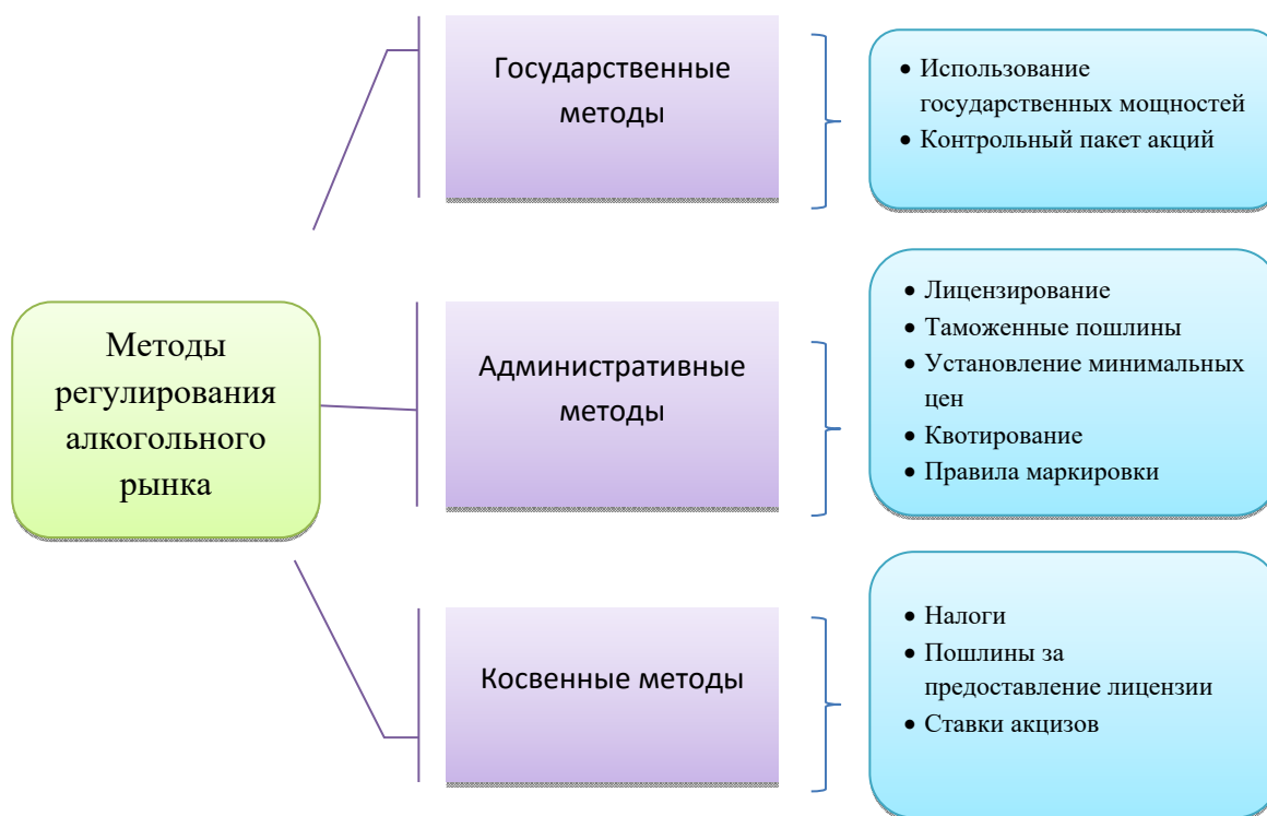
Рисунок 2 – Методы регулирования алкогольного рынка

Все это должно привести к снижению уровня смертности населения, связанному со злоупотреблением алкогольной продукцией. Главными показателями, доказывающими, что поставленные цели достигнуты являются: