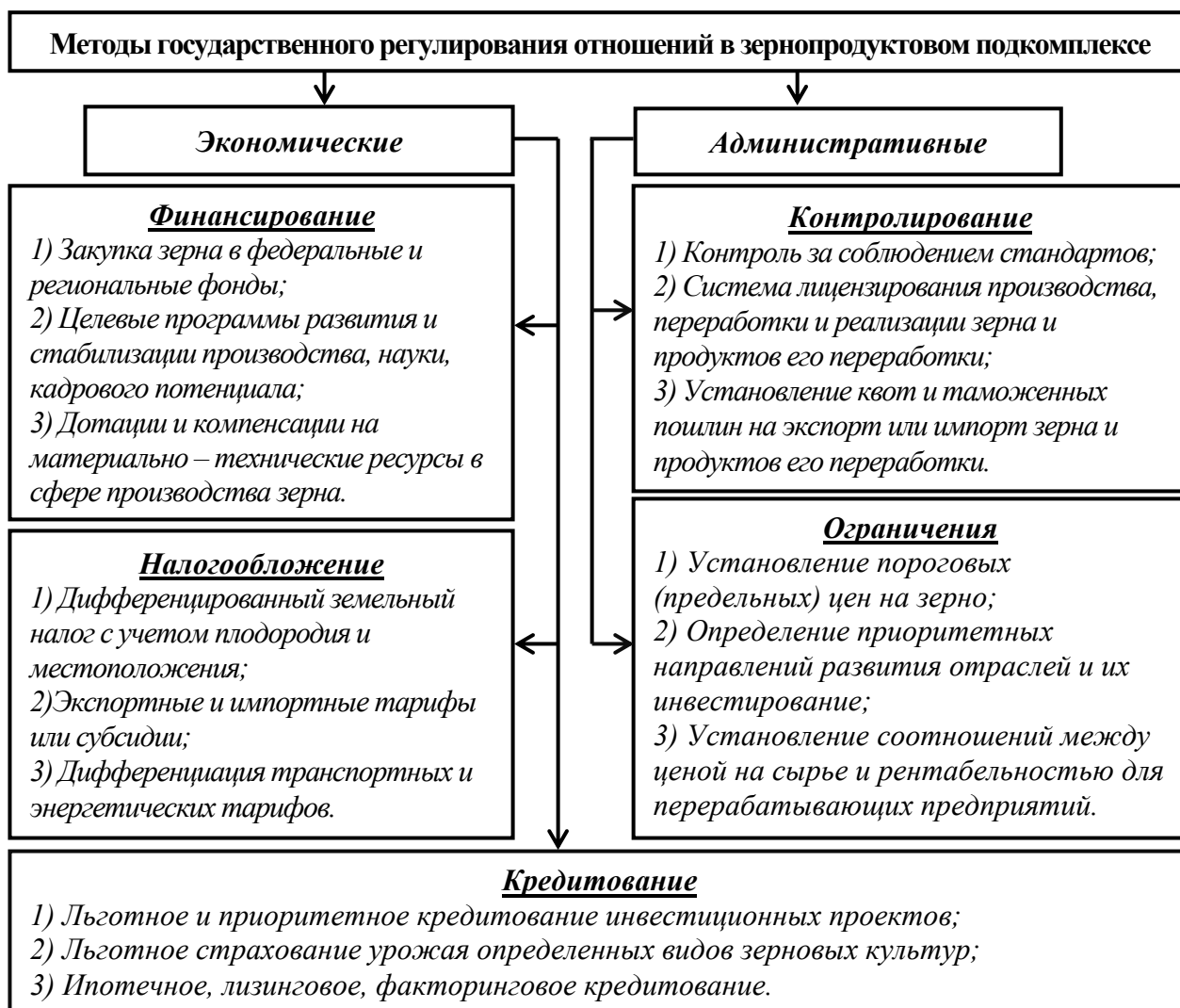
Р и с у н о к 1 – Система методов государственного регулирования развития зернопродуктового подкомплекса

продукции и повышение его эффективности, а с другой стороны – на совершенствование конъюнктуры рынка зерна, в том числе и стимулирование межрегионального взаимодействия с целью обеспечения потребностей в зерне в целом по стране [2].