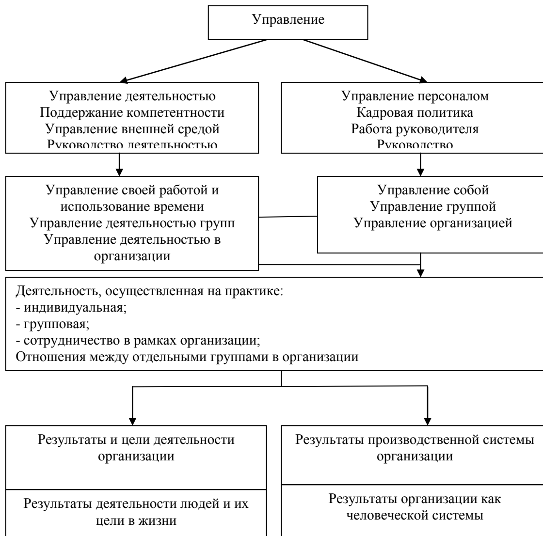
Рисунок 1 – Управление как организация деятельности предприятия

В современном мире позиция менеджера рассматривается так, что если человек находится в руководящей должности любого уровня управления в любых предприятиях, организациях, учреждениях и фирмах, то в своей деятельности, успешной и продуктивной, ему необходимы базовые знания в области теории и методологии управления персоналом. Управление в организации играет ключевую роль, т.к. без данных мероприятий организация деятельности предприятия не имеет будущего (Рисунок 1).