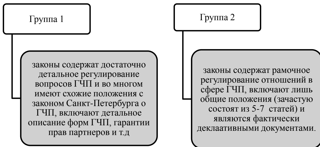
Р и с у н о к 2 – Группы региональных законов о ГЧП

Анализ регионального законодательства в сфере ГЧП позволяет выделить две основные группы региональных законов о ГЧП, которые имеют ряд особенностей, позволяющих объединить те или иные регионы (рисунок 2).