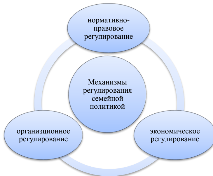
Р и с у н о к 1 – Государственное регулирование семейной политикой

Кроме этого целевые ориентиры совершенствования состояния семейной политикой определены Концепцией социально-экономического развития России до 2020 года, Концепцией государственной семейной политики российской Федерации на период до 2025 года, Концепцией демографической политики и Национальной стратегией действий в интересах детей [5].