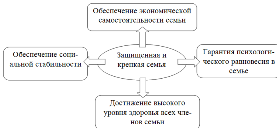
Р и с у н о к 4 – Направления по развитию института семьи в Республике Мордовия

способствовать введению ипотеки с отсрочкой платежа и под низкий процент, а так же увеличить объемы строительства жилья. Создать условия для сокращения уровня бедности и увеличения помощи нетрудоспособным членам семьи, ввести льготную систему. Необходимо материально поддерживать беременных женщин, семей с детьми-инвалидами, неполных, многодетных и малообеспеченных семей. Создать благоприятные условия труда для работников, имеющих малолетних детей и оказывать содействия в трудоустройстве или развитии малого бизнеса.