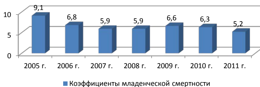
Р и с у н о к 1 – Кoeffициенты младенческой смертности, (число детей, умерших в возрасте до 1 года, на 1000 родившихся живыми)

семейных связей, росту числа детей, оставшихся без попечения родителей, постоянного места жительства, утрате средств к существованию. Безнадзорность детей продолжает составлять одну из наиболее тревожных характеристик современного российского общества. К семьям группы риска относят: неполные семьи, семьи, воспитывающие или имеющие в своем составе инвалидов, многодетные семьи, малоимущие и бедные семьи и др. исходя из выше описанных критериев. Одним из показателей, характеризующих данную группу проблем, являются показатели младенческой смертности (рисунок 1).