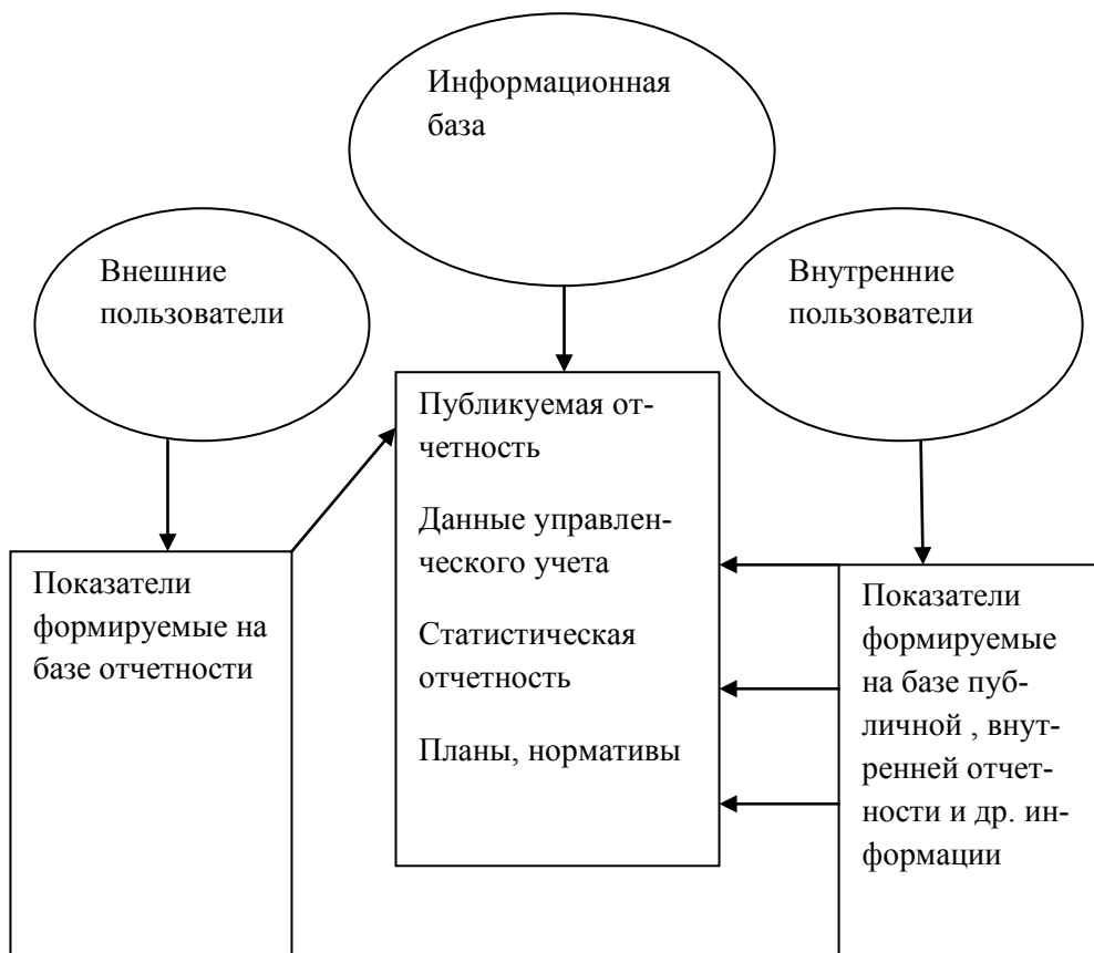
Р и с у н о к 1 Информационная база оценки результативности и ее пользователи

Процесс исследования и направления анализа для достижения поставленных экономических целей можно представить в виде блоков, характеризующих осуществляемую предприятием производственно-финансовую деятельность (рисунок 2).