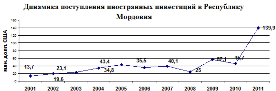
Р и с у н о к 2 Динамика поступления иностранных инвестиций в Республику Мордовия за 2001-2011 гг.

ных средств и оборудования» (0,4%), «прочие производства» (0,4%). В 2011 года объем инвестиций в основной капитал (без субъектов малого и среднего предпринимательства) составил 37,1 млрд. рублей (109,5% к соответствующему периоду 2010 года). Динамика поступления инвестиций от иностранных инвесторов в Республику Мордовия за последние десять лет представлена на рисунке 2.