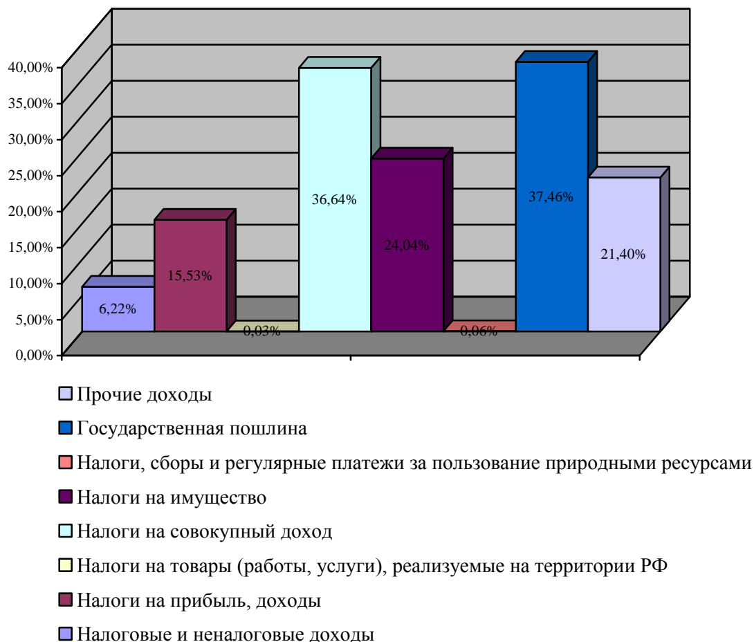
Р и с у н о к 1 Доля местных бюджетов в структуре доходов консолидированного бюджета РФ на 01.01.2011г., %.

На 01.01.2011 года имеются следующие данные по доле местных бюджетов в структуре доходов консолидированного бюджета РФ.