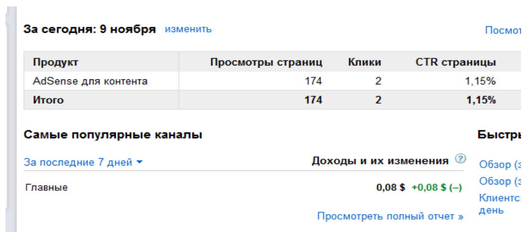
Р и с у н о к 2 Сводка Google Analytic

Одним из показателей, отражаемых в сводке Google Analytic, является CTR.