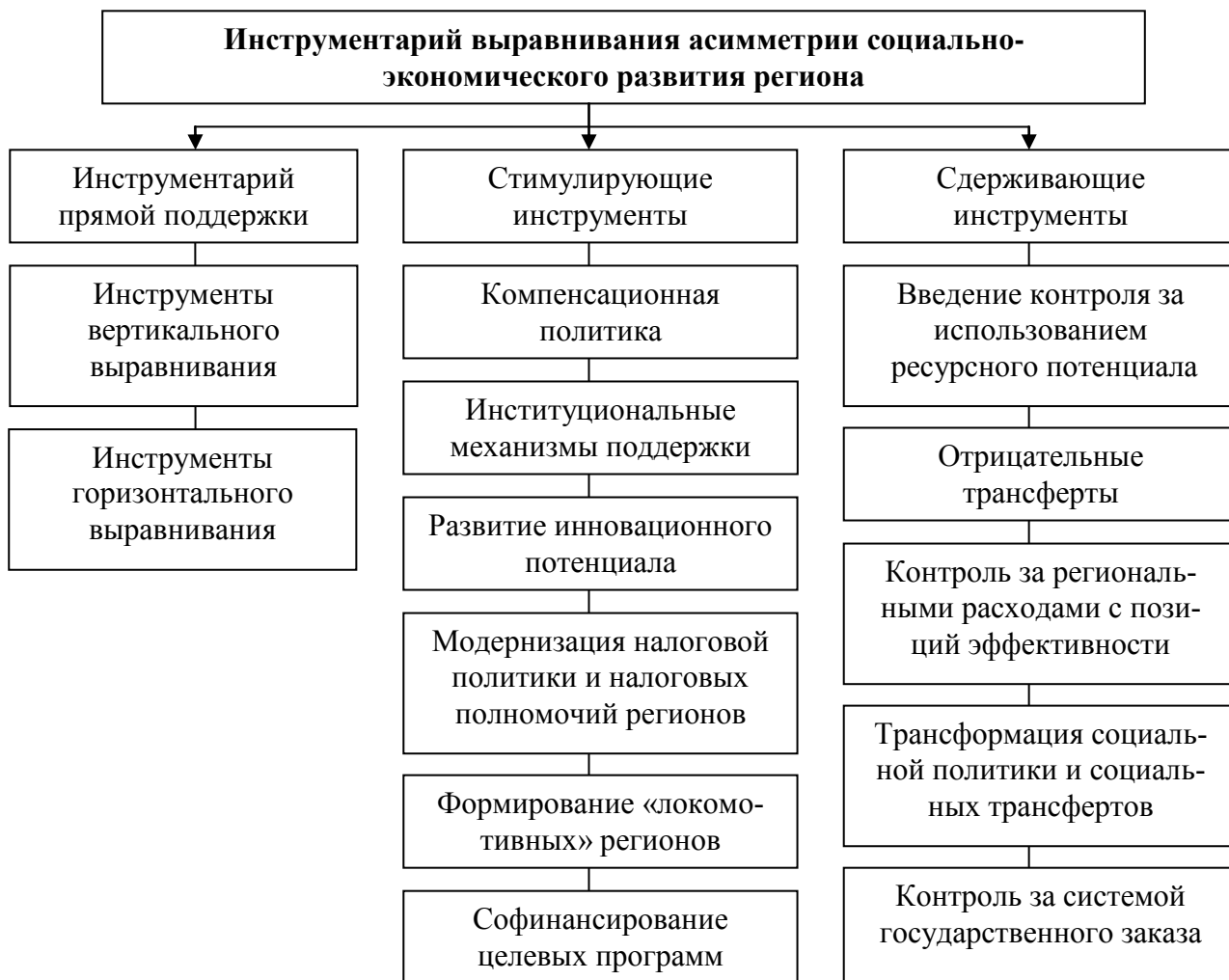
Р и с у н о к 3 – Инструменты выравнивания асимметрии социально-экономического развития региона

Следует отметить, что стимулирующий аспект выравнивания, должен проявляться в формировании источников притока инвестиций в регионы и поиске резервов для софинансирования социально-экономического развития, включая предоставление финансовой помощи [2].