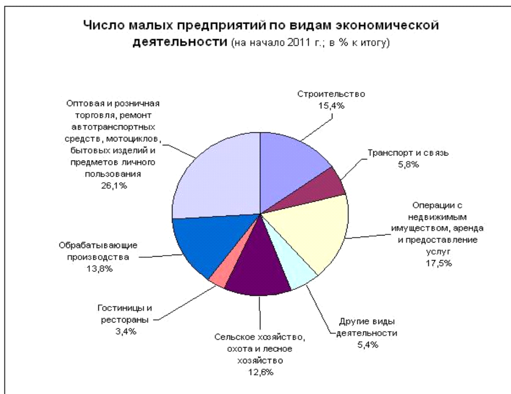
Р и с у н о к 1 – Число малых предприятий по видам экономической деятельности

Наибольший удельный вес занимают малые предприятия в сфере оптовой и розничной торговли; ремонта автотранспортных средств, мотоциклов, бытовых изделий и предметов личного пользования, их доля в общей структуре составила 26,1%. Второе место – операции с недвижимым имуществом, аренда и предоставление услуг – 17,5%, строительство – 15,4%, сельское хозяйство, охота, лесное хозяйство – 12,6%, другие виды деятельности 5,4% (рисунок 1).