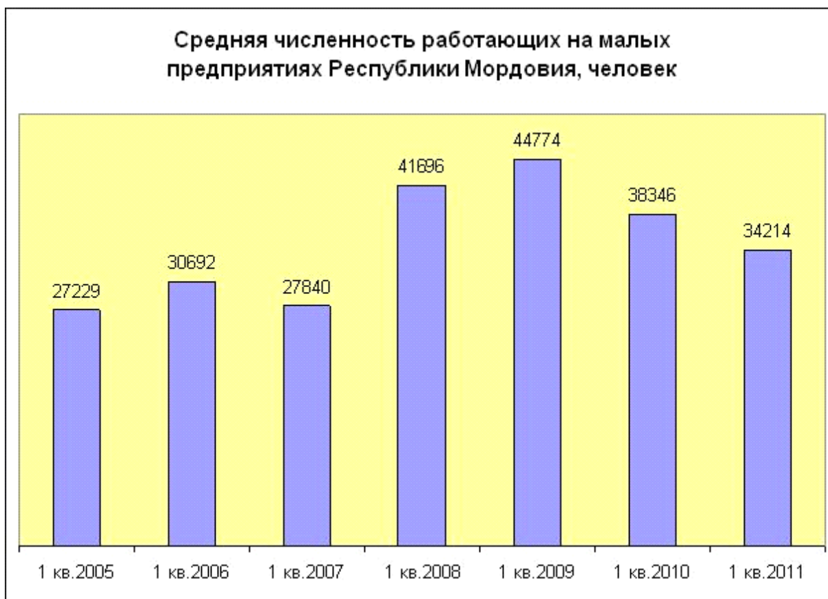
Р и с у н о к 2 – Средняя численность работающих на малых предприятиях Республики Мордовия

34214 человек. Лидирующая позиция по количеству работников принадлежит следующим видам деятельности: оптовая и розничная торговля; ремонт автотранспортных средств, мотоциклов, бытовых изделий и предметов личного пользования (24,3% от общего количества занятых на малых предприятиях), операции с недвижимым имуществом, аренда и предоставление услуг (17,6%), сельское хозяйство, охота и лесное хозяйство (15,4%).